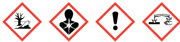
GHS09 GHS08 GHS07 GHS05 خطر

Bisphenol-A-Epichlorhydrin Epoxy resin Average MW < 700 ; Formaldehyde, oligomeric reaction products with 1-chloro-2,3-epoxypropane and phenol ; Reaction products of hexane-1,6-diol with 2-(chloromethyl); 1,3 Propanediol, 2 ethyl-2-(hydroxymethyl)-, polymer with 2-(chloromethyl)oxirane